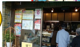
ワンコインスタンプラリー