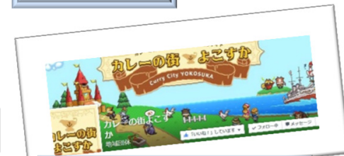
カレーの街よこすか