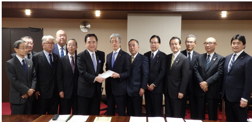
黒岩知事に要望書を提出する 県連上野会頭・県下会議所会頭