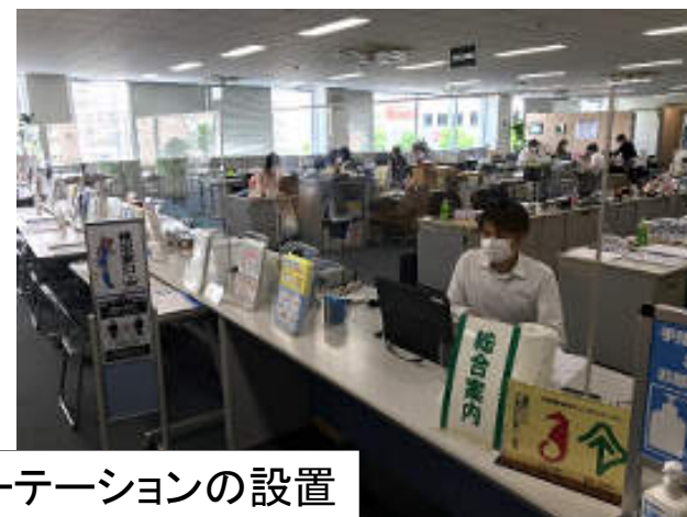
パーテーションの設置