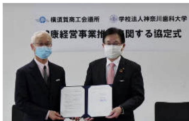
神奈川歯科大学鹿島理事長と平松会頭