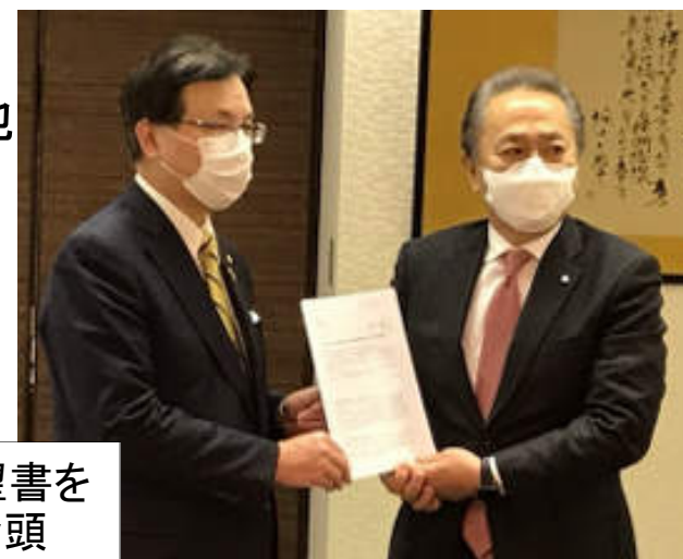
上地市長に要望書を提出する平松会頭