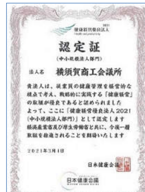
健康経営優良法人認定証

本事業連携として、当所2階に「健康経営コーナー」を開設し、健康経営に関する展示、資料を用意。