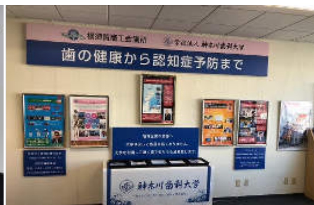
当所2階健康経営コーナー