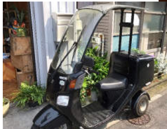
デリバリー用バイクとオリジナルパーカー

2019年オープン。タコスやブリトーを中心としたメキシコ料理のお店として経営していたが、コロナによって売上が激減。商工会議所に相談し、新たな事業形態を模索。補助金を活用して新分野へのチャレンジを続けている。