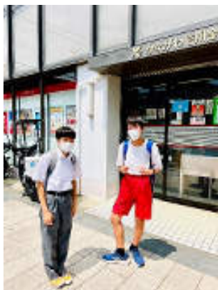
かながわ信用金庫

夏休み、冬休み、春休みの長期休暇の期間に、下記7事業所に職場体験の受入れを実施。生徒たちはまた行きたい、他の会社も経験したいと、とても前向きに取り組んだ。