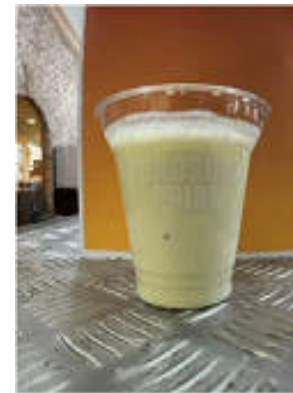
開発したまぐろいもラッシー