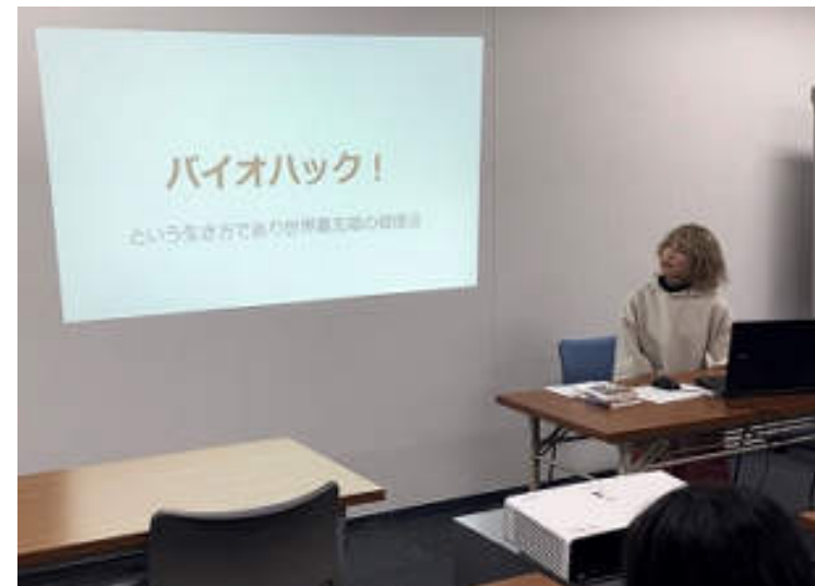
スタートアップ塾 成果発表会の様子