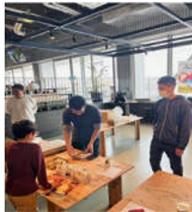
自分の商品を販売