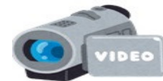
筆ロックイベントの様子