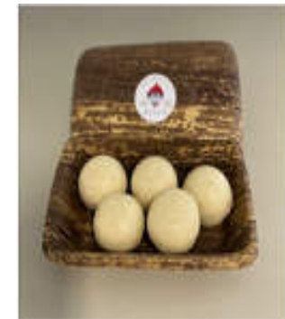
開発したまぐろいも饅頭