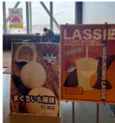
生徒が作成したポスター（右）