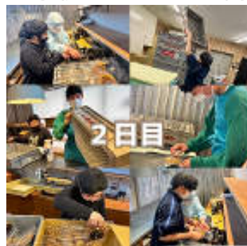
ホウトウベーカリー