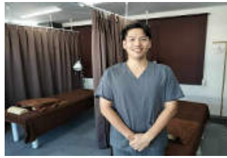
横須賀えびの治療院