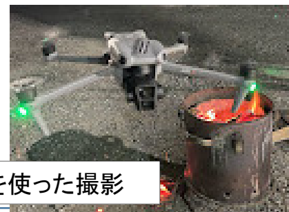
ドローンを使った撮影

「サーフィンのライディングの模様を、ドローンで撮影しイメージビデオにしてプレゼント！」したい