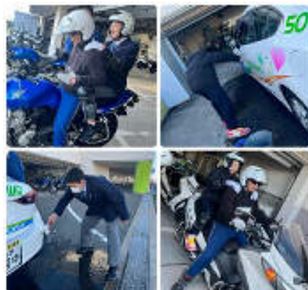
久里浜自動車学校