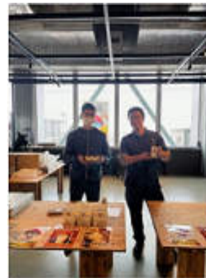
商品開発した生徒二人