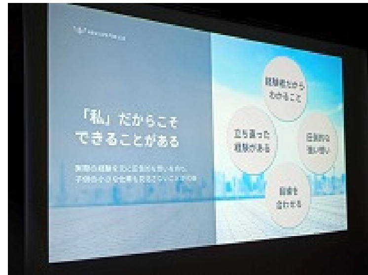
クオリティの高いビジネスプランが完成