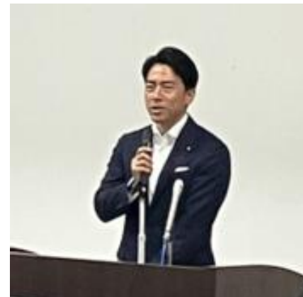
来賓あいさつをする 小泉進次郎衆議院議員