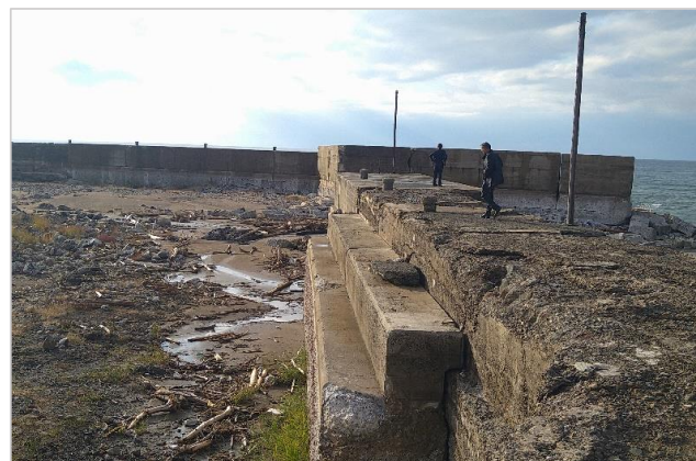
地震により隆起した黒島漁港