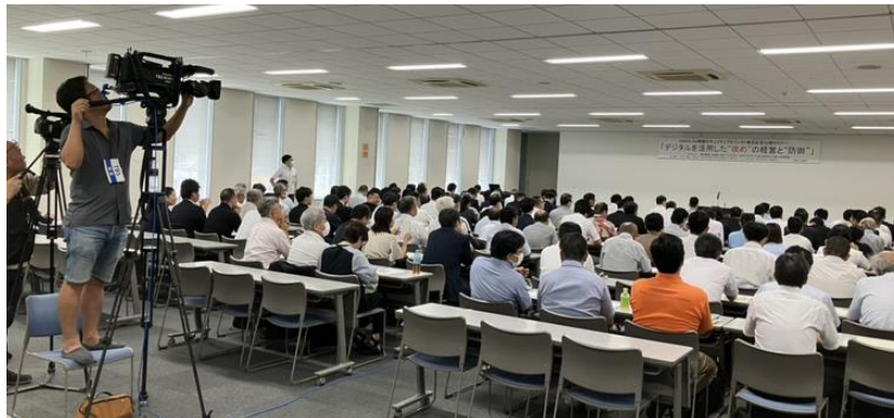
160人を超える来場者