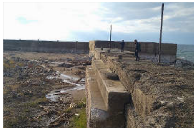
地震により隆起した黒島漁港