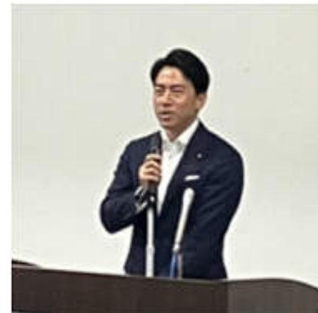
来賓あいさつをする 小泉進次郎衆議院議員