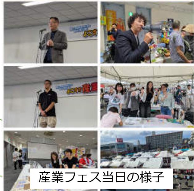
産業フェス当日の様子