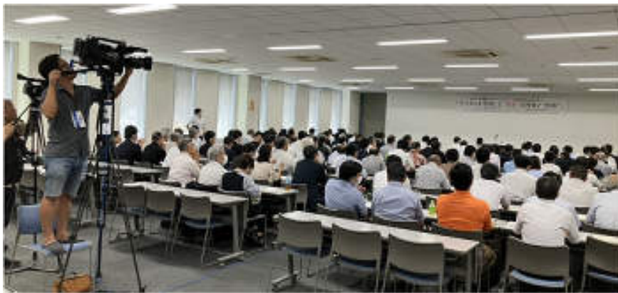
160人を超える来場者