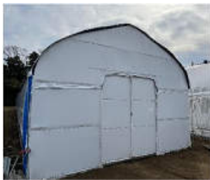
研修施設用ハウス外観