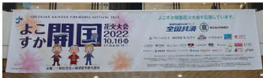
企業名横断幕 掲出（イメージ）