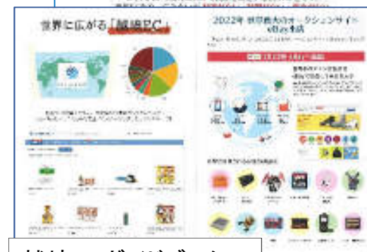
越境ECガイドブック