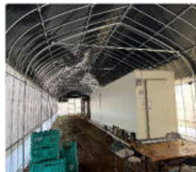
研修施設用ハウス内観