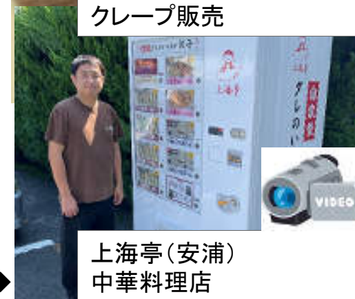
上海亭(安浦) 中華料理店

コロナ禍で落ち込んだ売上を回復させる手段として、看板メニュー『タレがいない餃子』を冷凍食品として製造し、自動販売機で販売する新規事業に着手！