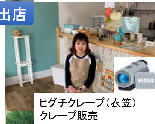
ヒグチクレープ(衣笠) クレープ販売