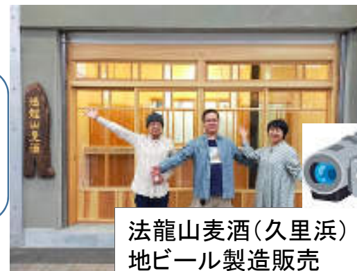
法龍山麦酒(久里浜) 地ビール製造販売